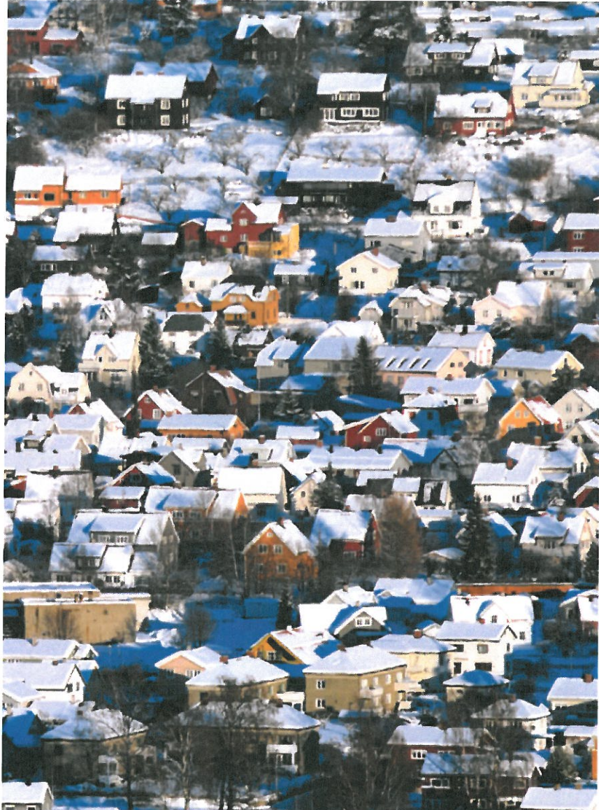
radonmålingene. Kommunen sa nei, men nå har Fylkesmannen opphevet vedtaket. Det kan få enorme