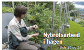
Nybrottsarbeid i hagen Side 20 og 21