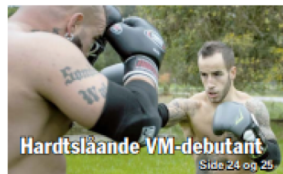
Hardtslående VM-debutant Side 24 og 25