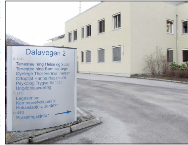
SKYHØGT: Sjukefråværet i Sogn barnevern er framleis svært mykje større enn elles i Sogndal kommune.

– Eg ynskjer ikkje spekulera i årsakene til dette. Men