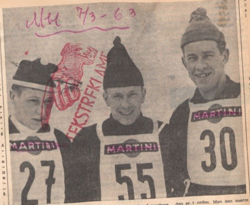
Det var stillet store forventninger... bla nr. 1 i 1963/64. For å markere den er i orden. Man kan se...