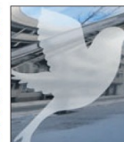
Duen. Fredsduen er et vanlig symbol på døden.

Det finnes også en klagenemnd, som pårederne kan kontakte dersom de føler seg feilaktig behandlet av et gravferdsbyrå. «Klagenemnda for gravferdstenen» består av en jurist, en representant fra Forbrukerrådet, og en representant fra gravferdsbransjen.