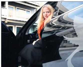
Flyttet. Bodin Gravferd har nettopp etablert seg i nye lokaler i Sambogården i Bodo sentrum. Her er bedriften godt synlig.