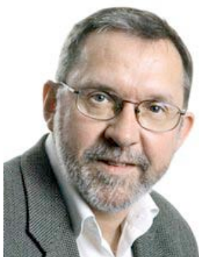
Harald Stanghelle Aftenposten