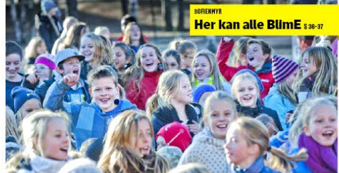
DRIFEMYR Her kan alle BlumE § 38-37

Tipstelefon: 64 877 877 Topp@oblad.no MMS/SMS: obladp til 2 097 Abonnementer: 85 23 32 30 Åravgifter: Man-fre 08.00 - 16.00