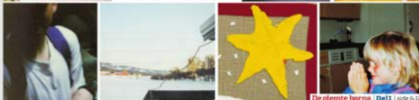
De glemte barna | Del 1 | side 6-12

42 offentlige omsorgspersoner er dømt for overgrep mot 52 barn de skulle passe på. Adresseavisen har som første avis kartlagt overgrepene. Les barnas historier.