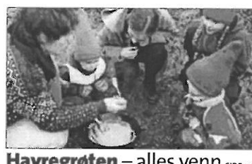
Havregrøten - alles venn SIDE 25