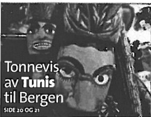
Tonnevis av Tunis til Bergen SIDE 20 OG 21