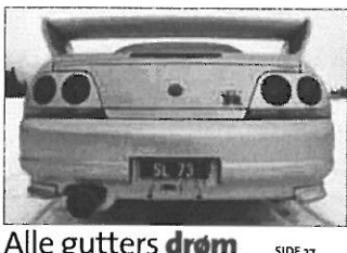
Alle gutters drøm SIDE 27