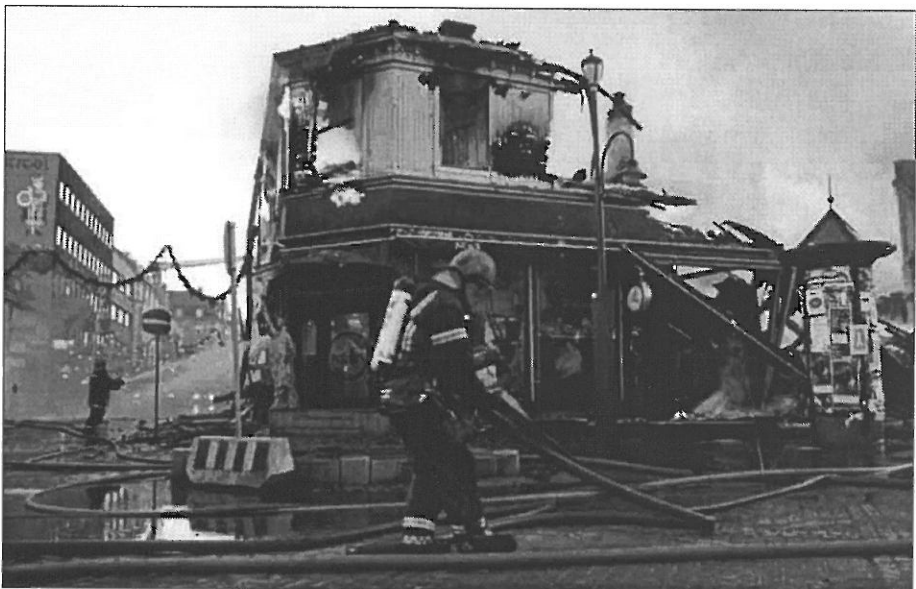
TREHUSKVARTAL ØDELAGT: Storbrannen i Trondheim startet i bakgården på hjørnet av Nordre gate og Thomas Angells gate og spredte seg raskt til naboeiendommene. Flere verneverdige trehus ble totalødelagt.