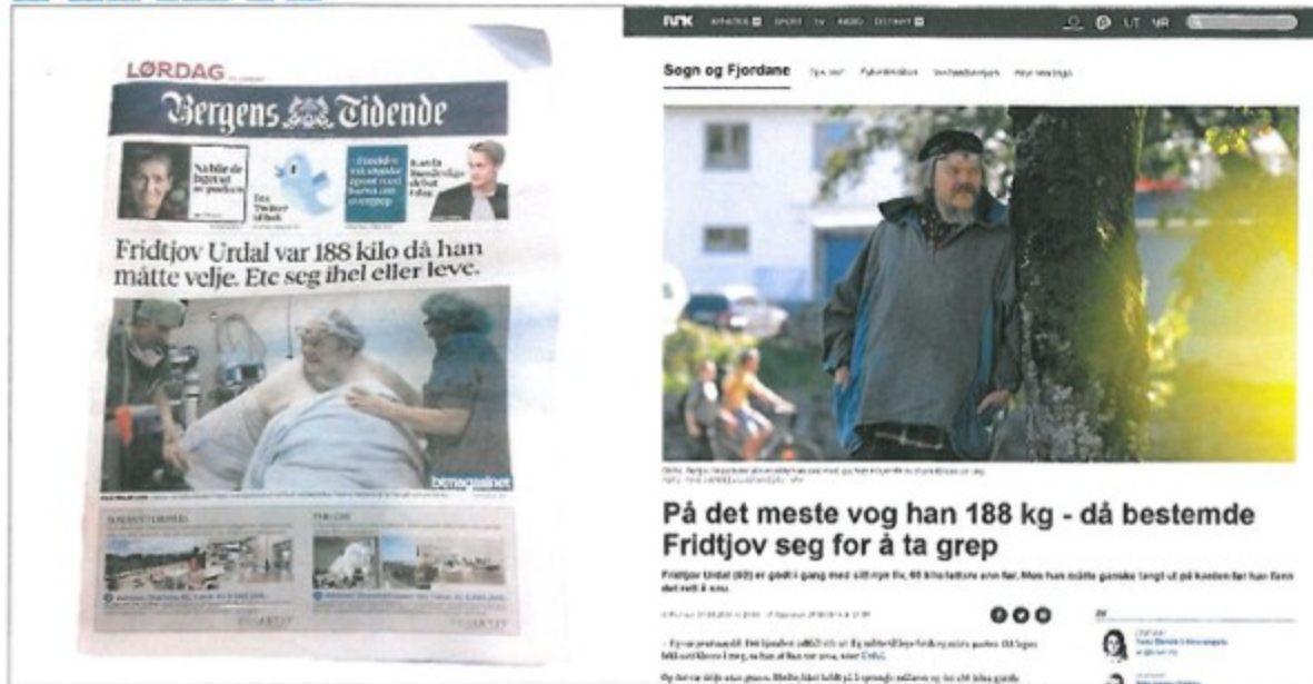
ORIGALEN OG ETTERLIKNINGA: Det blir ikkje lett for BT å ta betalt for saka si, når ei nærast identisk sak ligg gratis på NRK sine nettsider. Foto: FAKSIMILE

- Det skal ikkje bli lett å drive kommersielt, hvis NRK kan kopiere stoffet vårt